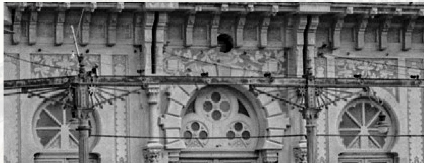
Gelosies planta baixa