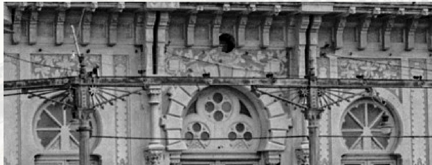
Gelosies planta baixa